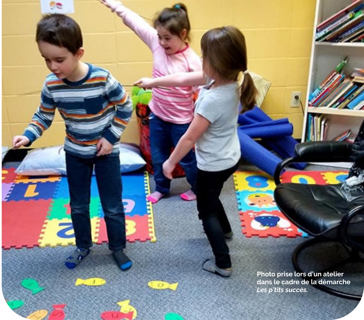
Photo prise lors d'un atelier dans le cadre de la démarche Les p'tits succès .