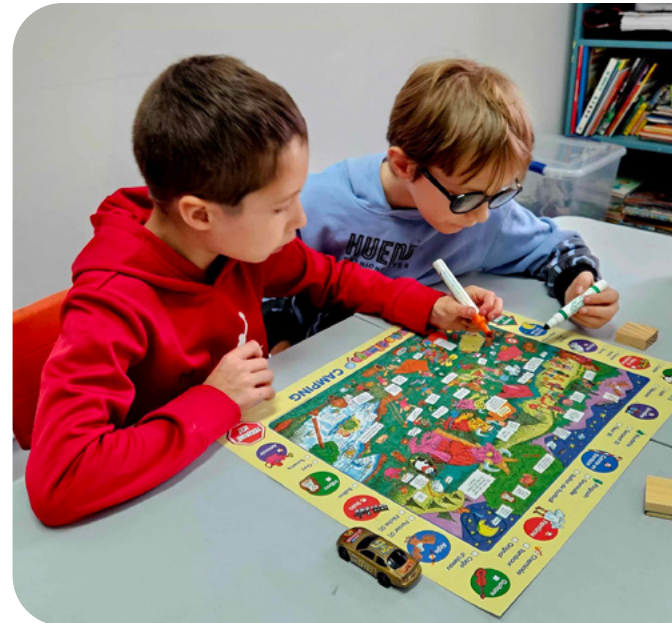
Photo prise lors d'un atelier dans le cadre de la démarche Les p'tits succès .