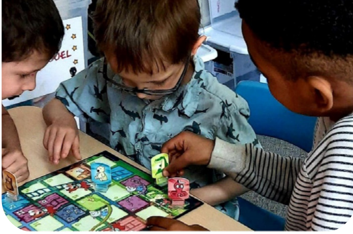
Photo prise lors d'un atelier dans le cadre de la démarche Les p'tits succès .